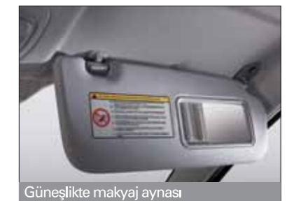
Güneşlikte makyaj aynası