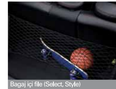
Bagaj içi file (Select, Style)