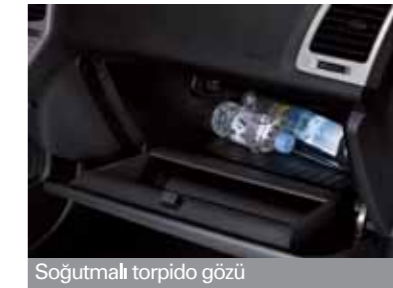
Soğutmalı torpido gözü