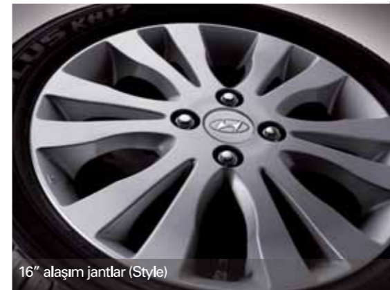
16" alaşım jantlar (Style)