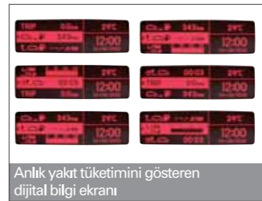
Anlık yakıt tüketimini gösteren dijital bilgi ekranı