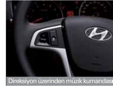
Direksiyon üzerinden müzik kumandası