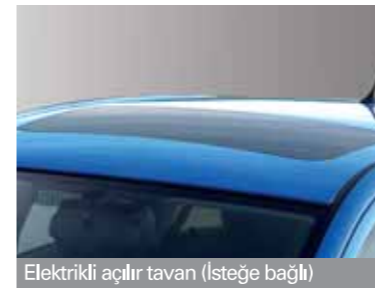
Elektrikli açılır tavan (Isteğe bağlı)