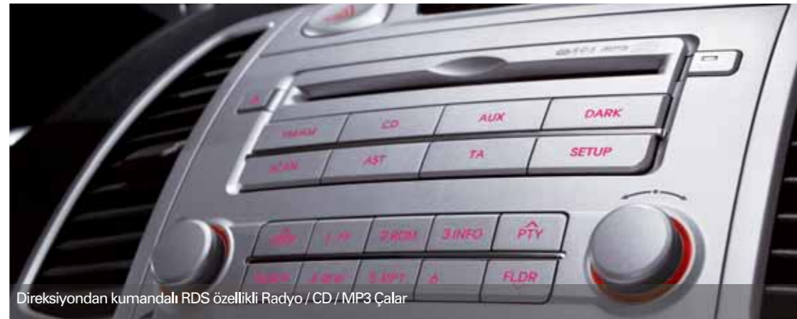
Direksiyondan kumandalı RDS özellikli Radyo / CD / MP3 Çalar