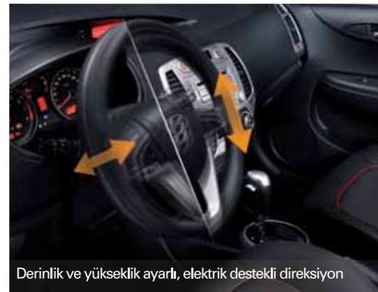
Derinlik ve yükseklik ayarlı, elektrik destekli direksiyon