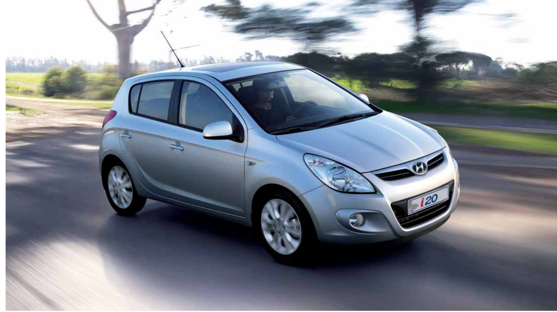
1.4 CRDi (75/90 PS)

i20'nin yeni 1.2 DOHC motoru 100 km'de ortalama 5,2 lt'lik yakıt tüketimi ve performansıyla sınıfının en iddialısı.