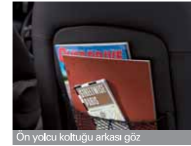
Ön yolcu koltuğu arkası göz