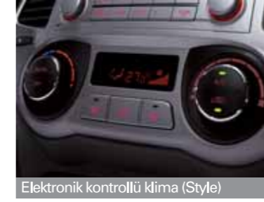
Elektronik kontrollü klima (Style)