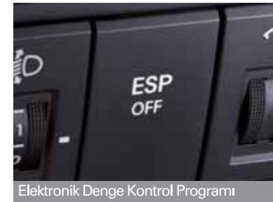
Elektronik Denge Kontrol Programı