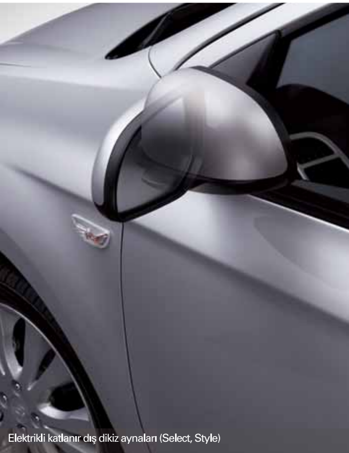
Elektrikli katlanır dış dikiz aynaları (Select, Style)