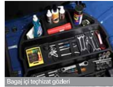
Bagaj içi teçhizat gözleri