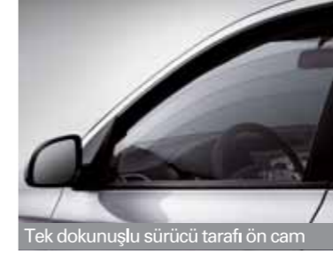
Tek dokunuşlu sürücü tarafı ön cam