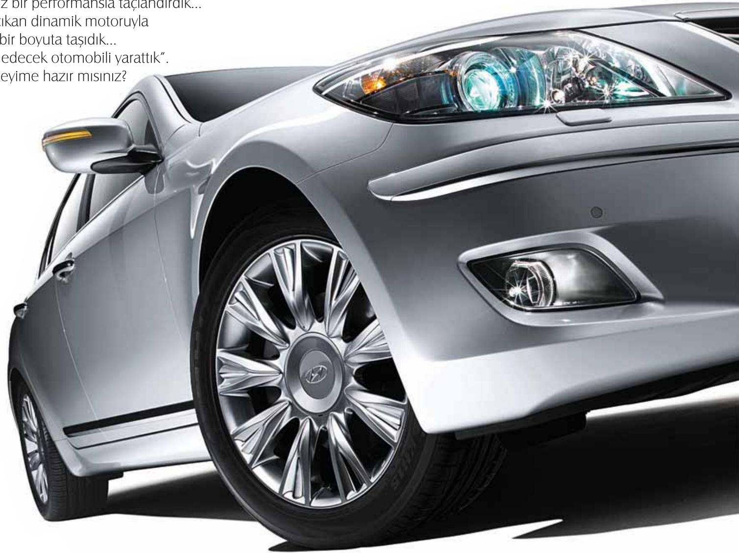
3.8 Lambda motor

Peki ya siz, rüya gibi bir deneyime hazır mısınız?