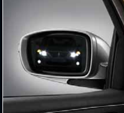
Katlanabilir elektrikli ısıtmalı dış dikiz aynaları