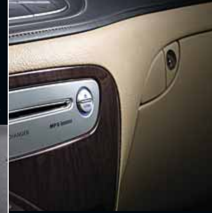
Deri kaplı göğüs