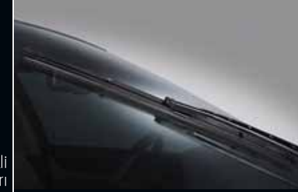
Elektronik Aero - Blade ön silecekler