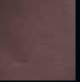
Ön Göğüs (deri)