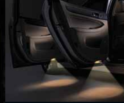
Kapı eşik aydınlatması