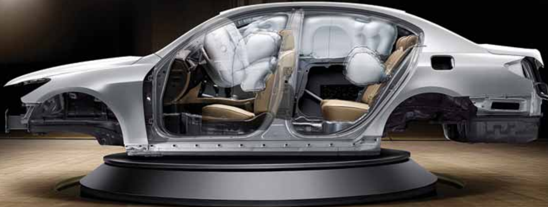
8 hava yastığı

Sınıfının sunduğu tüm standart güvenlik teknolojilerini, gelişmiş güvenlik anlayışıyla üst seviyeye taşıyan Genesis, evinizdeki gibi sonsuz güvenlik hissini tattırıyor. Bir sedan, güvenlikte ancak bu kadar iyi olabilir.