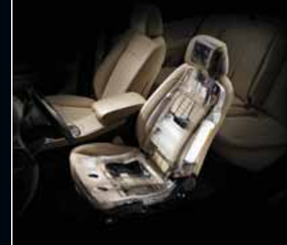
12 yöne ayarlanabilir havalandırmalı ön koltuk