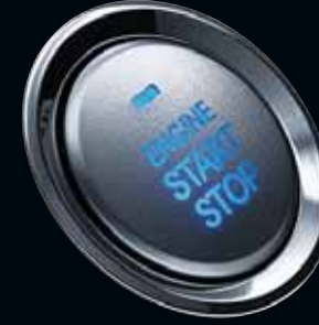
Motor çalıştırma düğmesi