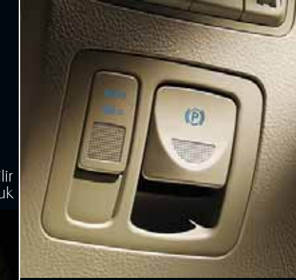
Elektrikli park freni